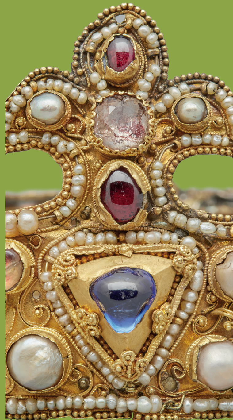
Essener Krone, 1020–1040 Domschatz Essen