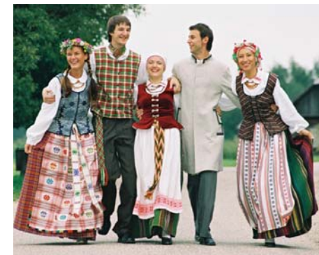
Das Musikensemble TUTO aus Litauen

Eine Kooperation mit dem Medienforum des Bistums Essen, Ort: Medienforum, Zwölfling 14, 45127 Essen.